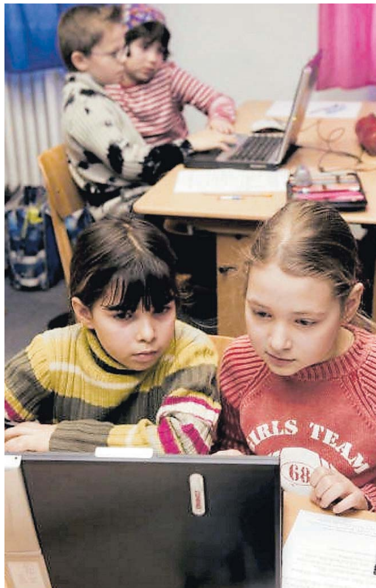
Immer mehr Schulen im Saarland nutzen die freie Lernsoftware „Moodle“ im Unterricht.

Entstanden ist ein Software-Paket, das mittlerweile in rund 200 Ländern in Schulen, Hoch-